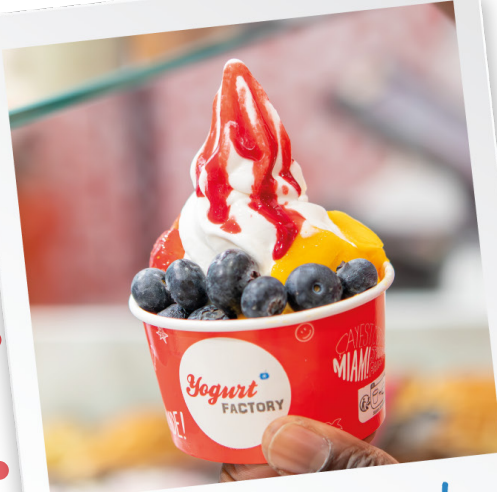
Glace au yaourt