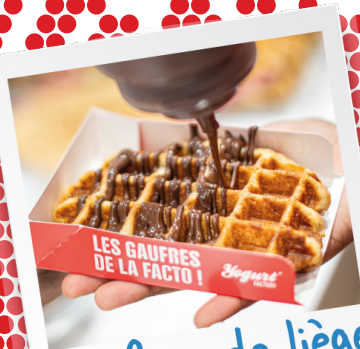
Gaufres de liège